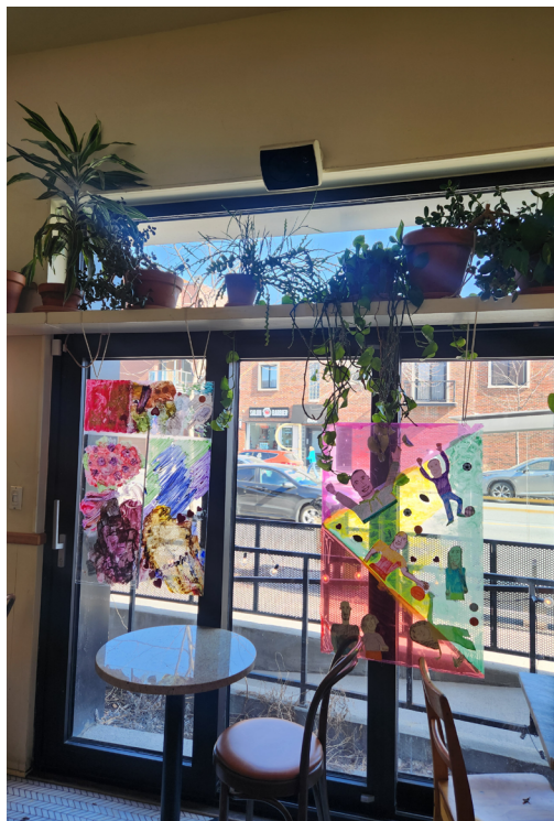
Vernissage Reflets d'amour