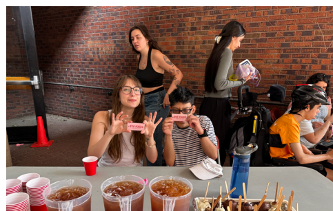
Projet Été Sucré